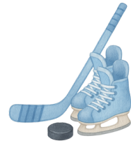
Le hockey sur glace