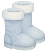
Les bottes d'hiver