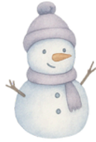
Le bonhomme de neige