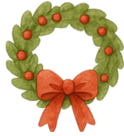
La couronne de l'Avent